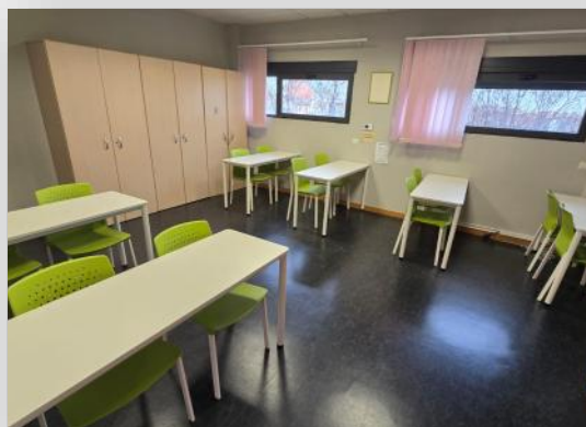
Actualizamos la sala de estudios con un nuevo mobiliario más adaptado.