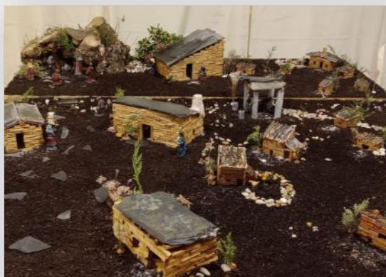
Primer Belén intergeneracional en el Centro de Mayores “Virgen del Rosario”