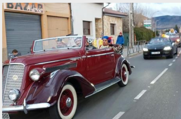
Los Reyes Magos eligieron coches clásicos para llegar a San Cristóbal este año.