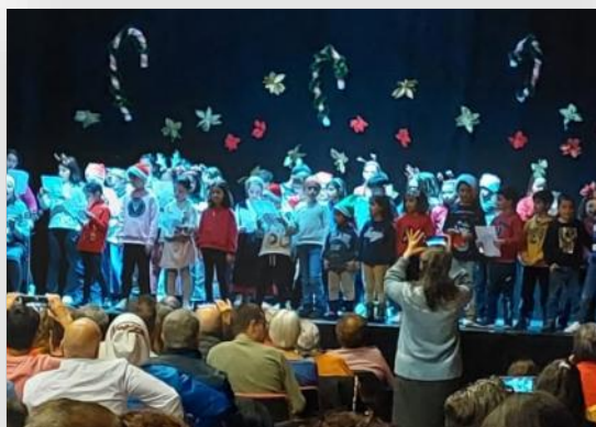
II Festival Navideño en nuestro municipio con gran afluencia.