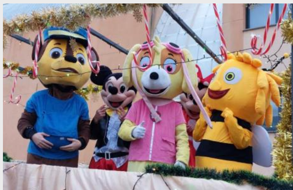
Los personajes preferidos de los niñ@s en la cabalgata de Reyes.