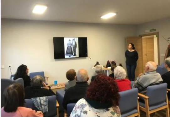
Nuestros mayores realizan actividades en el Centro de Mayores.