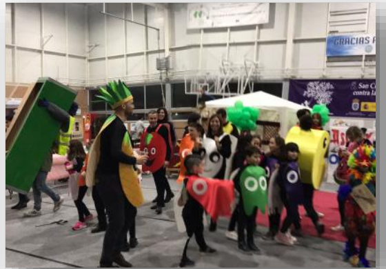
Celebramos Carnaval en San Cristóbal de Segovia.