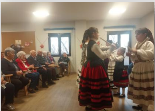
El grupo infantil de jotas visita el Centro de Mayores.