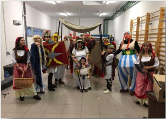
Celebramos Carnaval en San Cristóbal de Segovia.