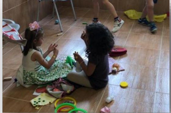
Los más jóvenes disfrutan de las actividades de “Sancris Joven”