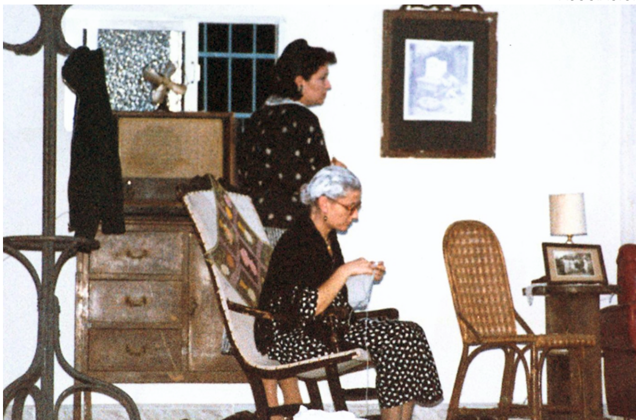
Perdidos en Yonkers (1994)