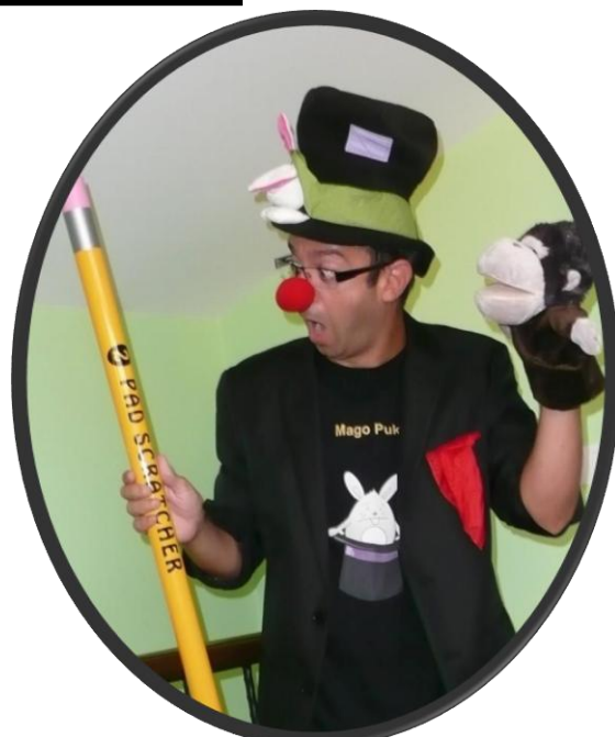
Mago Puk Miércoles 30 de Mayo