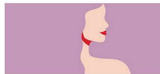
Asesoría para jóvenes víctimas de delitos sexuales

EL INSTITUTO ARAGONÉS DE LA JUVENTUD OFRECE A LA JUVENTUD ARAGONESA UN COMPLETO SERVICIO DE ASESORÍAS GRATUITAS.