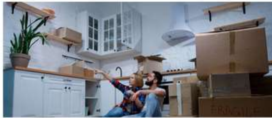
Asesoría de vivienda para jóvenes