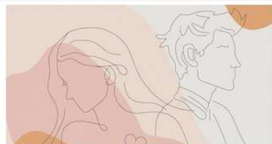
Asesoría afectivo-sexual para jóvenes

EL INSTITUTO ARAGONÉS DE LA JUVENTUD OFRECE A LA JUVENTUD ARAGONESA UN COMPLETO SERVICIO DE ASESORÍAS GRATUITAS.