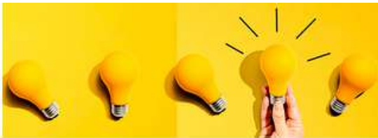
Asesoría fiscal y financiera para jóvenes emprendedores