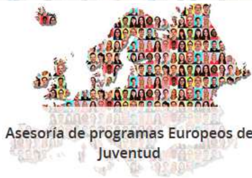
Asesoría de programas Europeos de Juventud