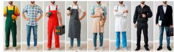
Asesoría de orientación laboral para jóvenes