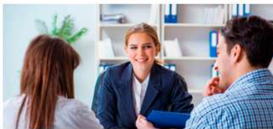
Asesoría jurídica para usuarios del Carné Joven Europeo en Aragón