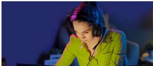
Asesoría de prevención digital