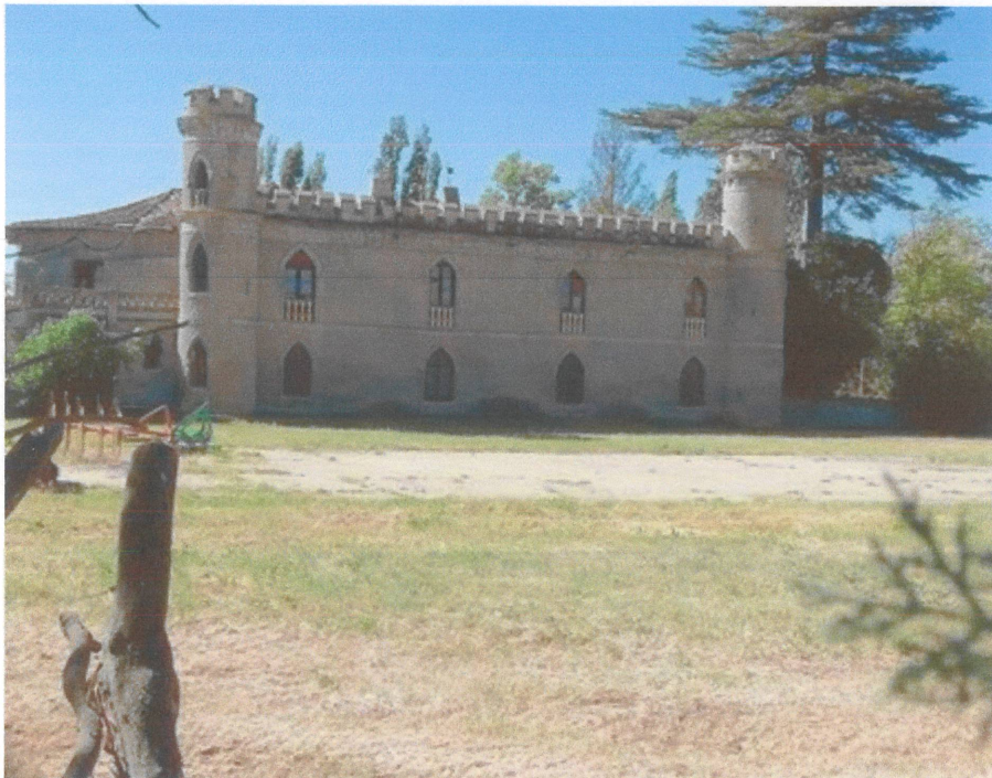
Priorato de Nuestra Señora del Duero

El día 20 de mayo de 2023 realizaremos una visita guiada al Priorato de Nuestra Señora del Duero, de Tudela, y los Cortados de Peñalba de Duero.