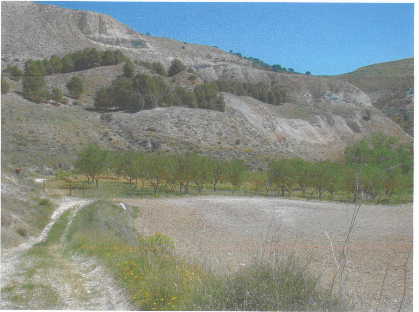
Entrada a Peñalba