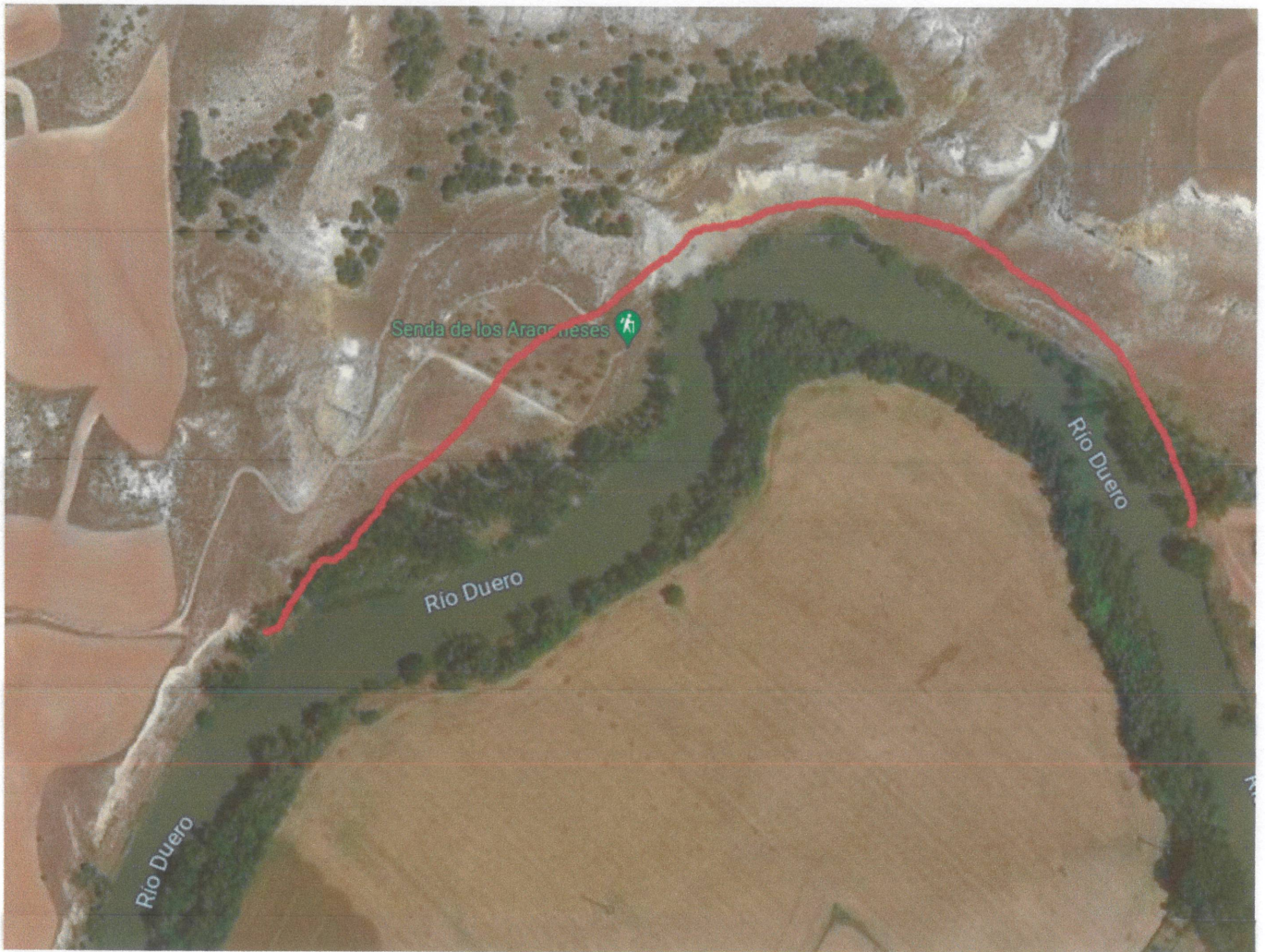
Probables modificaciones del meandro provocadas por los deslizamientos de tierra