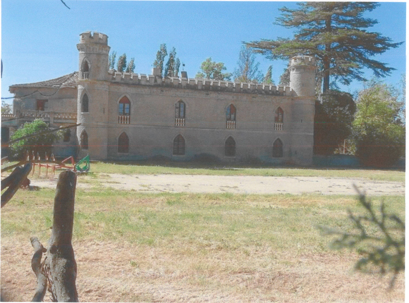
Edificio del Priorato de Santa María del Duero