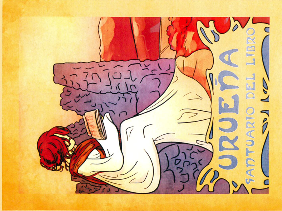
Celia Centeno Tundidor. Primer Premio de Ilustraciones, 2017