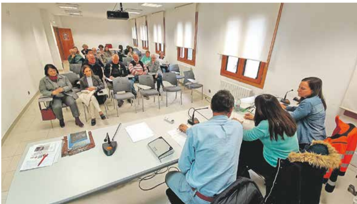
Foto: Constitución del Consejo de Salud de la Zona Básica de Daroca. Consejo de Salud de Daroca

El pasado 25 de febrero, se celebró en la sede de la Comarca Campo de Daroca la reunión constitutiva del Consejo de Salud de la Zona de Salud de Daroca. Este órgano, integrado por representantes municipales, sanitarios y sociales, tiene como objetivo coordinar acciones para mejorar la atención sanitaria y comunitaria en el territorio.