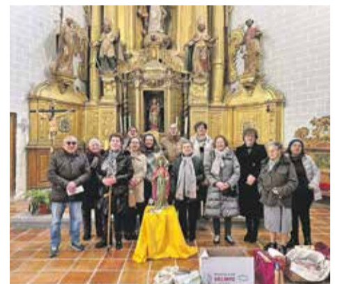
Foto: Celebración de Santa Águeda, en Mainar. Ayuntamiento de Mainar