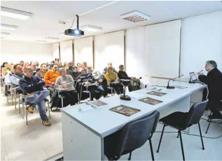
Foto: Primera sesión del I Curso de Historia de Daroca.

El I Curso de Historia de Daroca, que comenzó el pasado 3 de febrero, está superando todas las expectativas al atraer a un gran y entusiasmado grupo de participantes en todas las sesiones que se han celebrado hasta el momento.