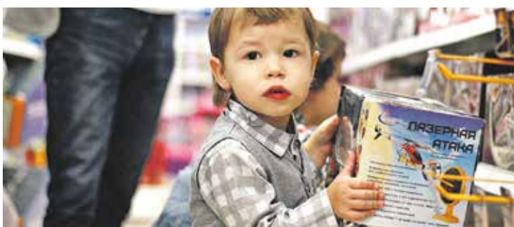
Foto: Niño en una juguetería.

La Oficina Comarcal de Información al Consumidor -OCIC- del Campo de Daroca recuerda a la población que cuenta con un perfil en Facebook, con el fin ofrecerles un servicio más accesible y directo. A través de esta plataforma, la OCIC pone a disposición de los consumidores información útil, consejos y asistencia personalizada para resol-