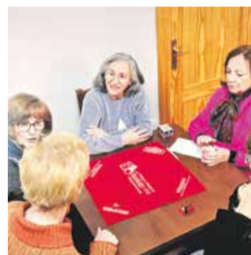
Foto: Concurso de rabino. Asociación de Mayores San Juan Bautista Herrera de los Navarros

El pasado 8 de febrero, el Centro de Mayores de Herrera de los Navarros se convirtió en el epicentro de la tradición y la convivencia, albergando el segundo campeonato de rabino, perejila y guiñote. El evento fue organizado por la junta de la Asociación de Mayores San Juan Bautista, con la colaboración del Ayuntamiento, y con-