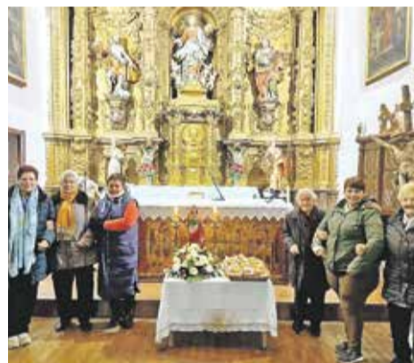
Foto: Santa Águeda, en Murero.