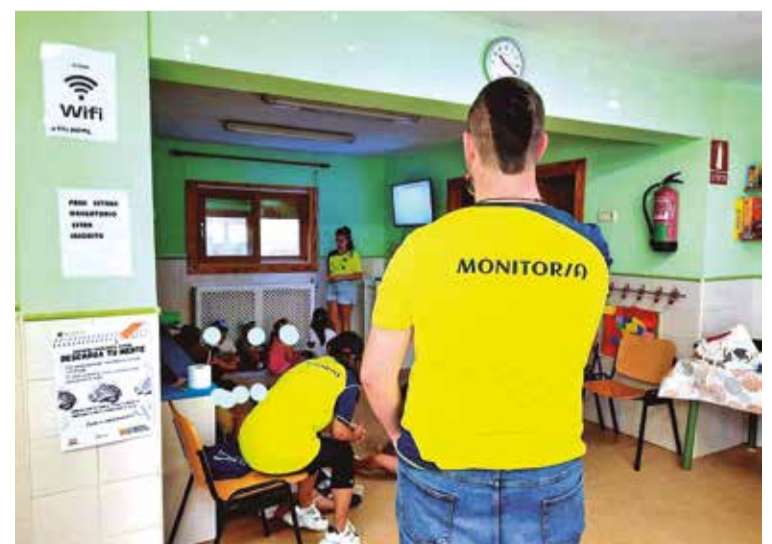
Foto: Monitores de Colonias de Verano 2023. Juventud Comarca de Daroca