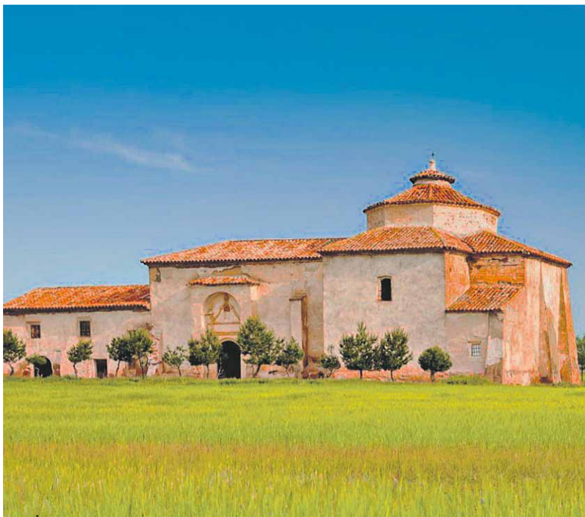
Foto: Ermita de Nuestra Señora de Tocón, en Langa del Castillo. Xilocapedia

LA DPZ HA PUESTO EN MARCHA UN NUEVO PLAN DE RESTAURACIÓN DE BIENES ECLESIASTICOS QUE INCLUYE 58 INTERVENCIONES EN IGLESIAS, RETABLOS Y OTRAS OBRAS DE ARTE DE LA PROVINCIA