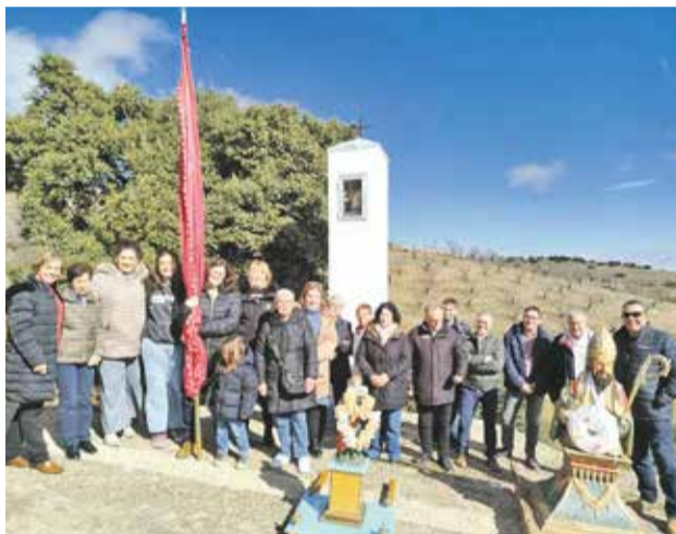
Foto: San Blas y Santa Águeda, en Val de San Martín.