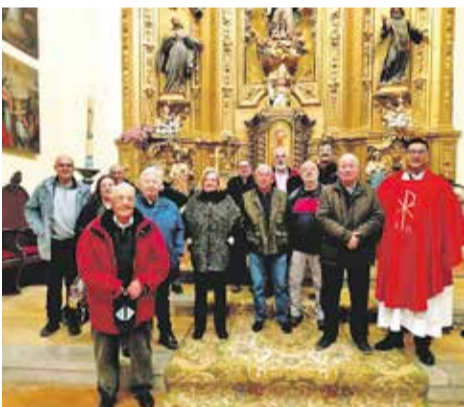
Foto: Santa Águeda, en Orcajo.