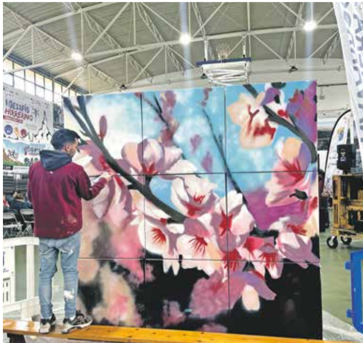
Foto: Mural de la foto ganadora del concurso. X Feria de la Almendra y el Cordero de Herrera