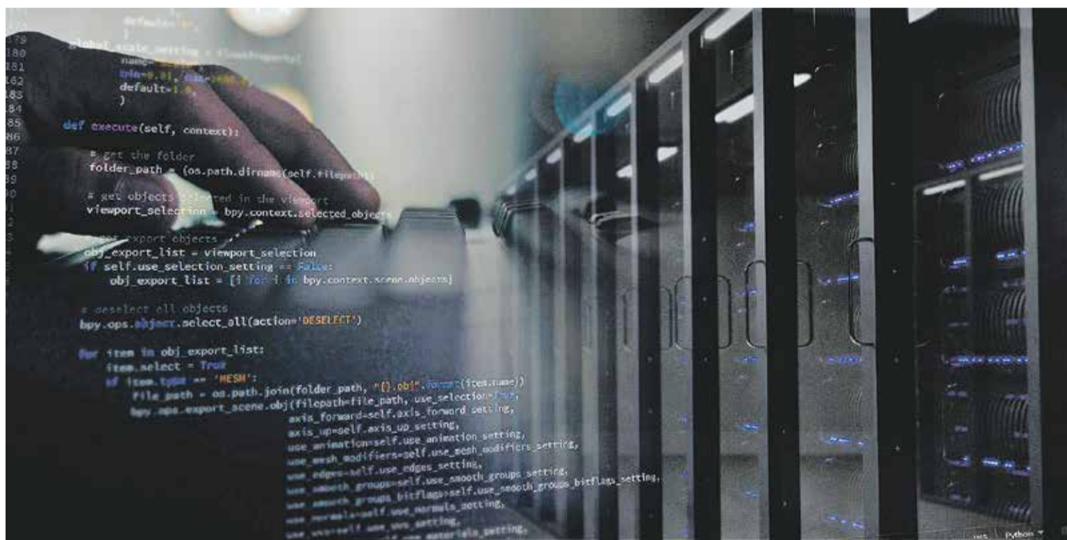
Foto: Los escritorios virtuales permiten que los ayuntamientos cumplan el Esquema Nacional de Seguridad en el ámbito de la administración electrónica. DPZ

En función de las solicitudes recibidas en aquel proceso, a 77 ayuntamientos zaragozanos se