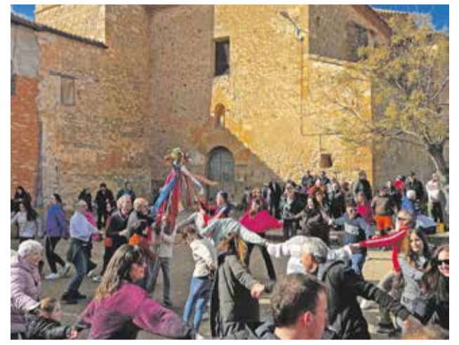
Foto: Procesión en honor a San Blas, en Torralba de los Frailes. Ruth Terrer