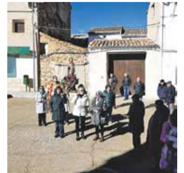
Foto: Santa Águeda, en Used. UP Daroca