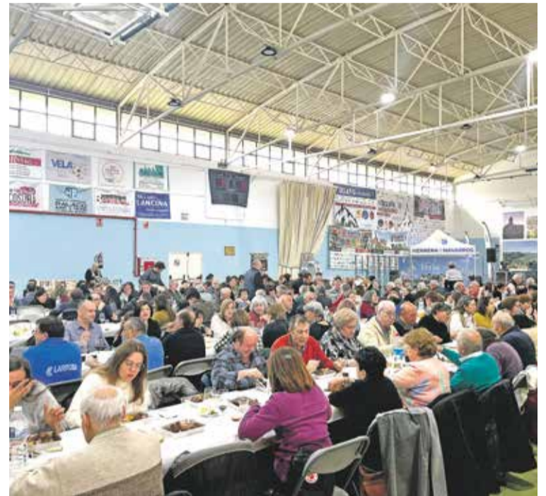
Foto: X Feria de la Almendra y el Cordero, en Herrera de los Navarros. Zumo Creativos

Por la tarde, los asistentes pudieron disfrutar de la magia de Deive & Ébano con su espectáculo "Origen", además de di-