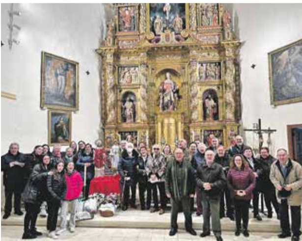
Foto: San Blas y Santa Apolonia, en Badules.