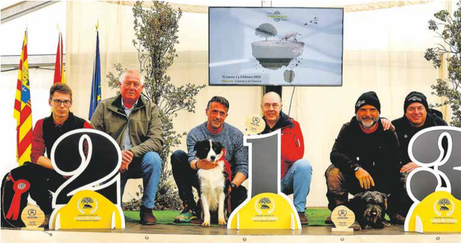
Foto: Ganadores del Concurso Nacional de Caza de Trufa. Turismo Comarca de Daroca