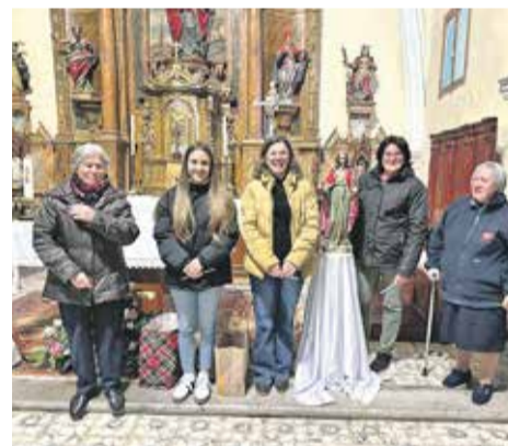
Foto: Santa Águeda, en Villadoz. UP Daroca