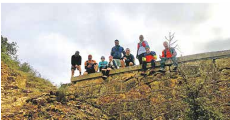
Foto: Reconocimiento de las ruta de la Daroca Trail 2025. Daroca Trail

● La cita se celebra el próximo 9 de marzo en la cabecera comarcal