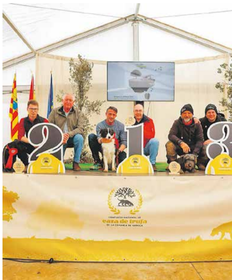
Foto: Ganadores del Concurso Nacional de Caza de Trufa.