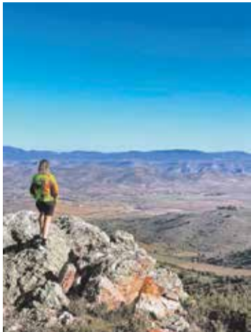
Foto: Exploración de la ruta para la Marcha Senderista Campo de Daroca en Cubel.

La Marcha Senderista Campo de Daroca, que se celebrará el próximo 16 de marzo en Cubel, encara sus últimos días de inscripción. Organizada por el