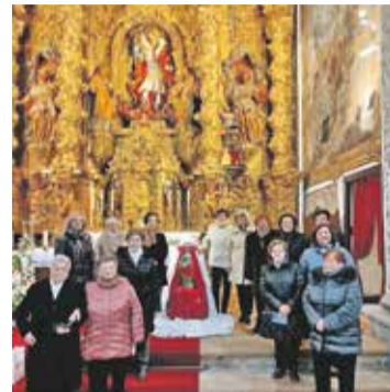
Foto: Santa Águeda, en Villarreal de Huerva. UP Daroca