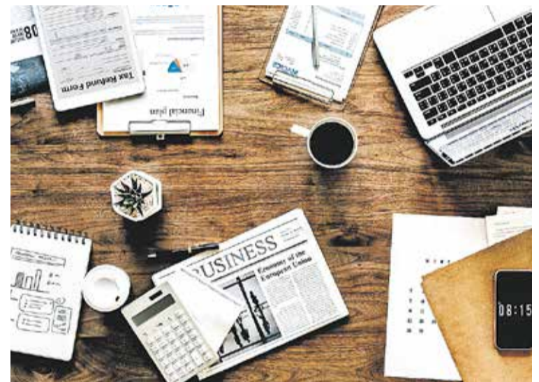
Foto: Mesa de oficina.