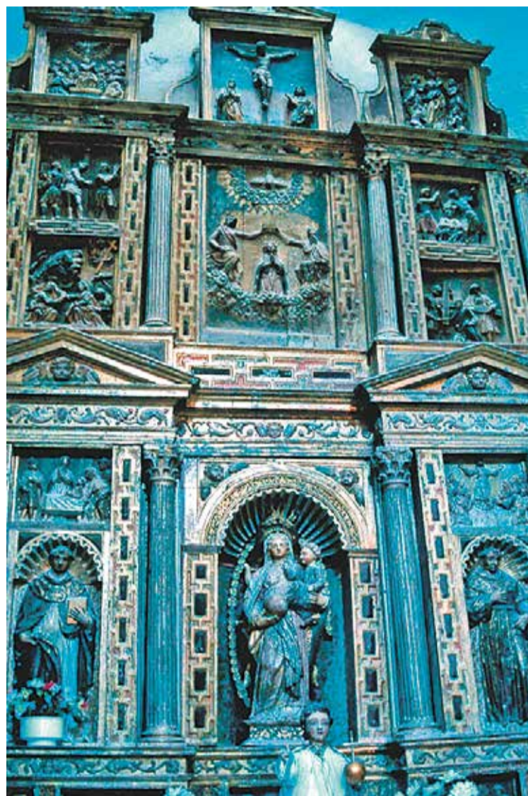
Foto: Retablo de la Virgen del Rosario de Retascón.