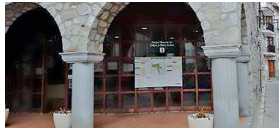
Plaza Mayor, 7. 22350. Bielsa. Tel. 974 50 10 43

Abierto todos los días en horario ininterrumpido de 9:00 a 15:30 h.