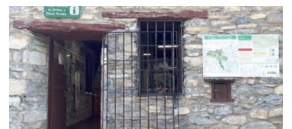
C/ Única, s/n. 22362. Escuaín. Tel. 974 94 15 60

Abierto todos los días en horario ininterrumpido de 9:00 a 18:00 h.