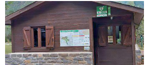
Pradera de Pineta. Inicio pista de La Larri