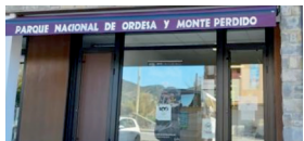
Avda. Pineta. Ed. Portal de Añisclo, 9. 22363. Escalona. Tel. 974 50 51 31

Abierto viernes, sábados y domingos (V a D) de 9:00 a 14:00 y de 15:15 a 18:00 h.