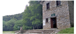
Pradera de Ordesa