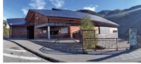
Avda. Ordesa s/n. 22376. Torla-Ordesa. Tel. 974 48 64 72

Abierto todos los días en horario ininterrumpido de 9:00 a 15:30 h.