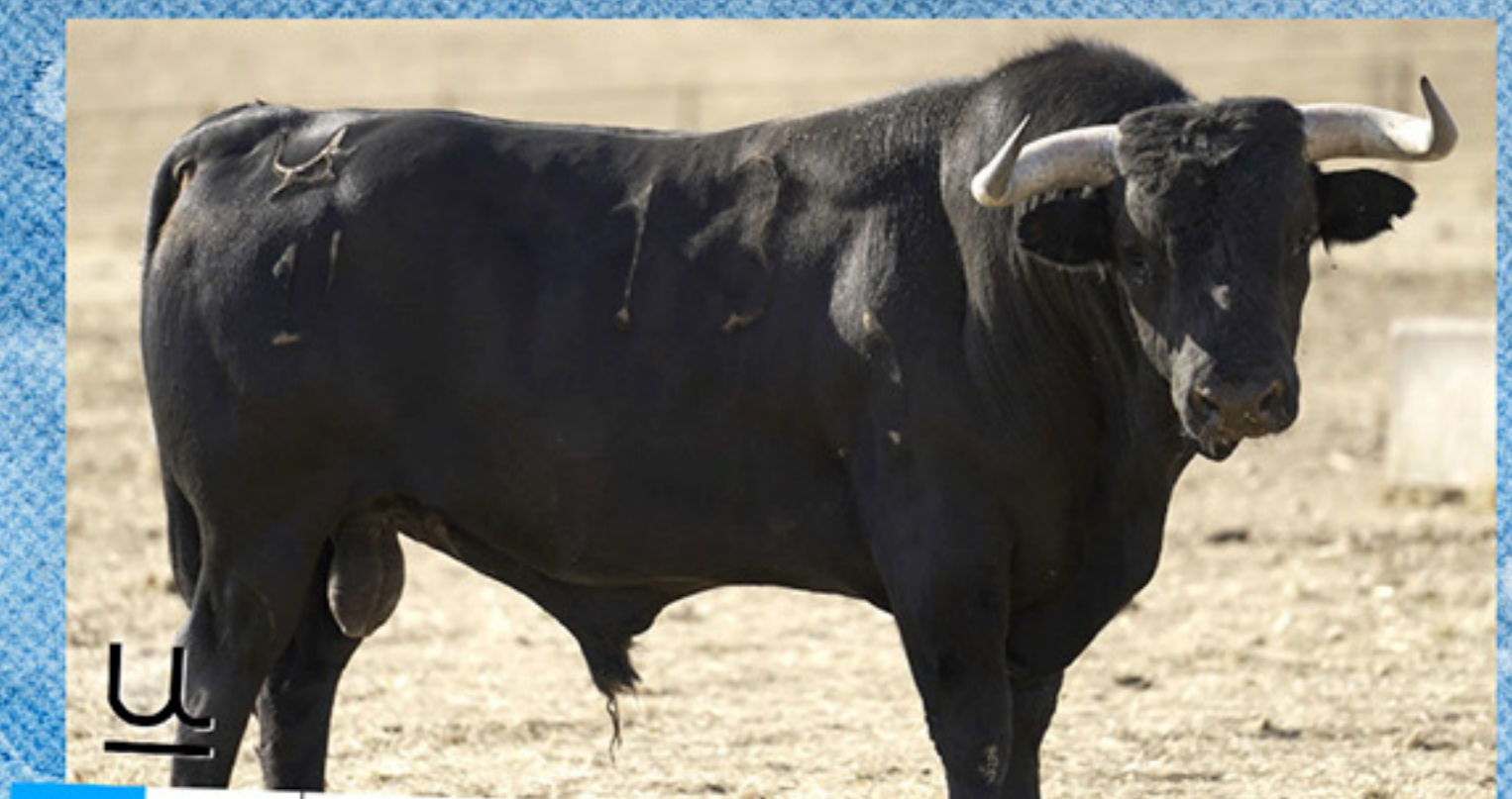
URCIA · "ANOTADO" · Nº 13 · G O