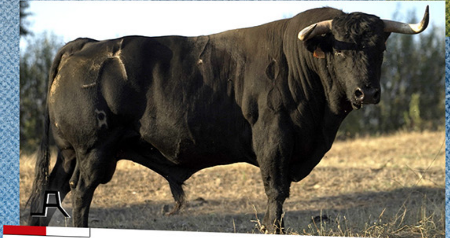
LOS LIANOS Y LA NAVA · "RABIOSO" · Nº 2 · G 8