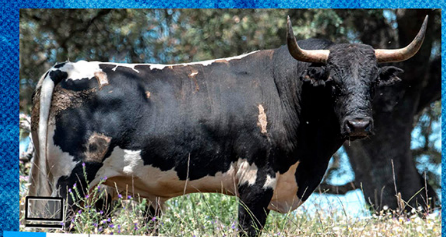
JARA DEL RETAMAR · "ONUBENSE" · Nº 7 · G 9