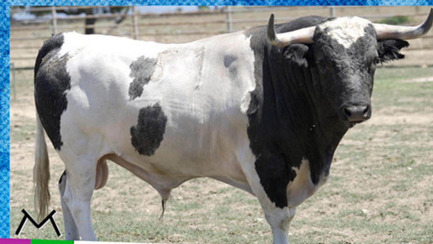
MONTEVIEJO · "RONDITO" · Nº 51 · G O