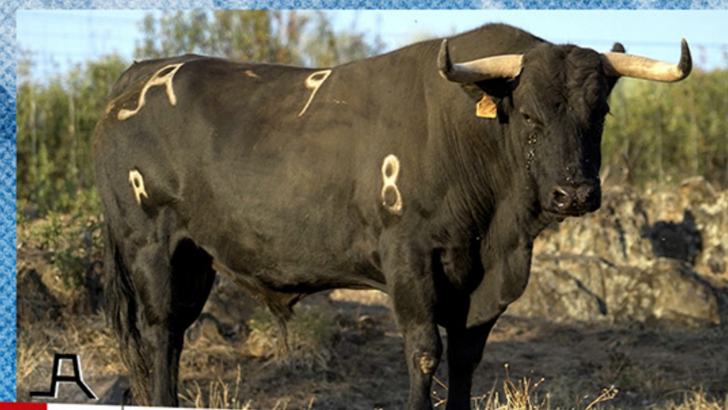
LOS LIANOS Y LA NAVA · "HISTERICO" · Nº 9 · G 8