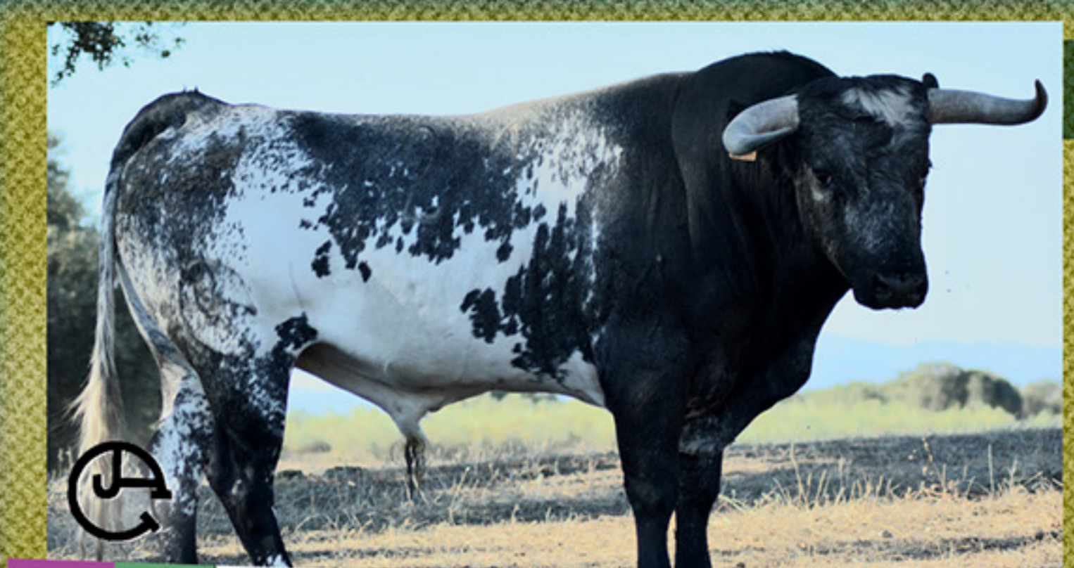
SAN MARTIN · "BIANQUEADO" · Nº 21 · G I