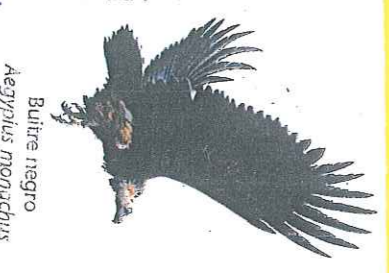
Buitre negro Aegypius monachus