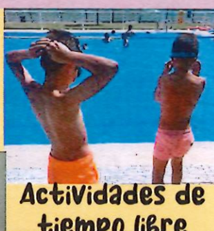
Actividades de tiempo libre