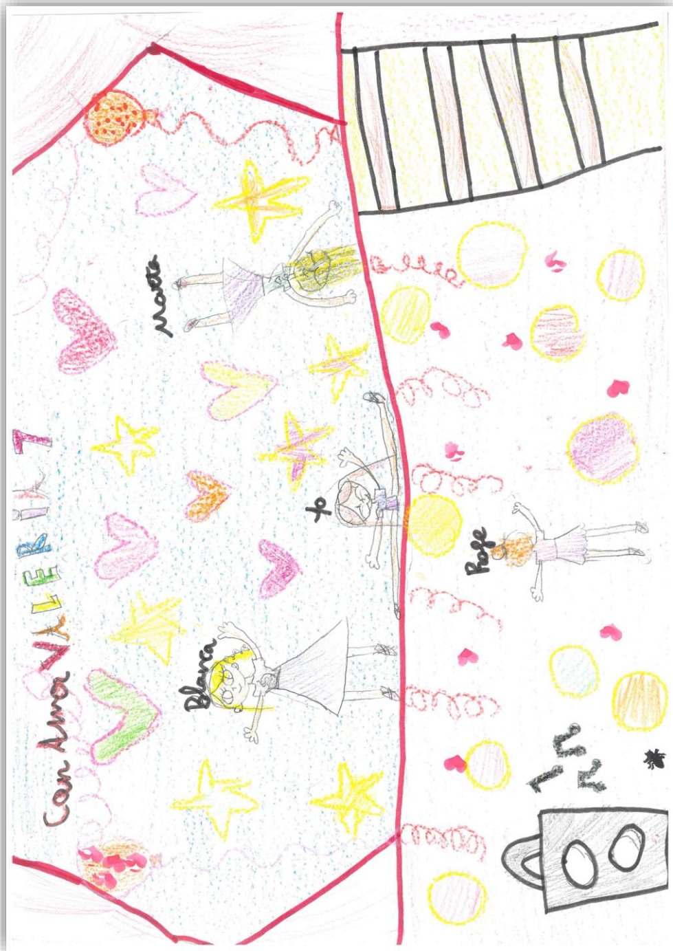
VALERIA PÉREZ SIMÓN - 7 AÑOS