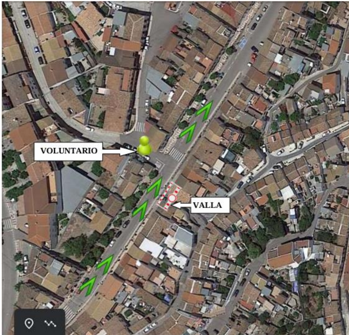
Voluntario en cruce C/ Virgen de la Candelaria con C/ Camino de Málaga.