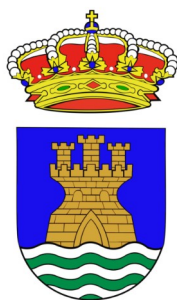
Ayto. El Burgo