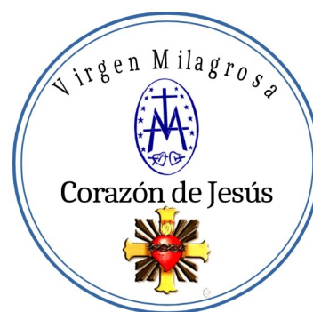
Hermandad del Sagrado Corazón y Virgen Milagrosa