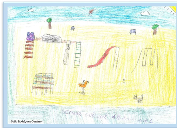
Concurso Ludoteca: "Semana Cultural – Albatana 2021"