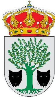
EXCMO. AYTO HERNÁN PÉREZ