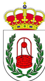
EXCMO. AYTO POZUELO DE ZARZÓN