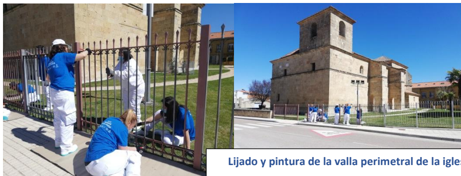
Lijado y pintura de la valla perimetral de la iglesia