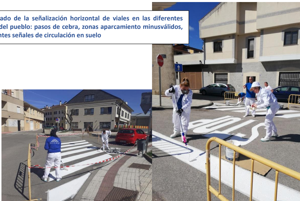
Repintado de la señalización horizontal de viales en las diferentes calles del pueblo: pasos de cebra, zonas aparcamiento minusválidos, diferentes señales de circulación en suelo