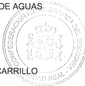
DOMINGO FERNÁNDEZ CARRILLO