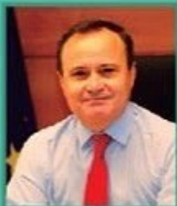
Ángel Viveros Gutiérrez Alcalde-Presidente

Tras este parón de dos años, forzado por la situación provocada por la pandemia, es muy grato anunciar que Coslada retoma con gran ilusión la Semana de la Salud que cumple su VIII edición. Desde el Ayuntamiento de tu ciudad queremos hacerte llegar la invitación para que participes a través de las actividades y talleres que se van a llevar a cabo del 2 al 8 de abril. El objetivo vuelve a ser el fomento de esos hábitos