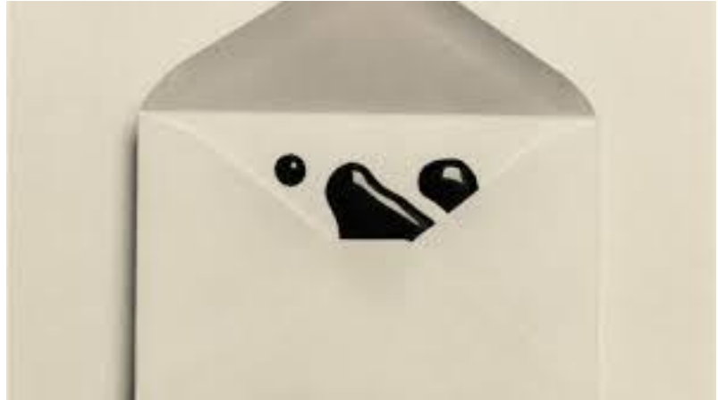
Fot. Chema Madoz

No soy, sin embargo, partidario de impartir doctrina sin más, toda vez que ello somete al alumno a una cantidad abrumadora de opciones y a un cierto formateo en detrimento de sus necesidades particulares, sino de ir abordando los aspectos teóricos relativos a la escritura en función de