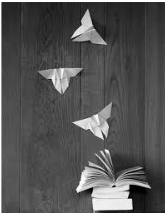
Fot. Chema Madoz