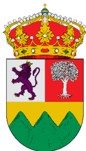
EXCMO. AYTO DE VILLANUEVA DE LA SIERRA