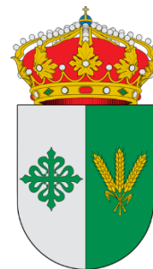
EXCMO. AYTO DE VILLA DEL CAMPO