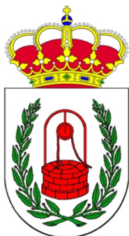
EXCMO. AYTO DE POZUELO DE ZARZÓN