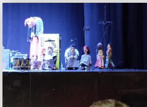
Titirimundi con Plansjet.