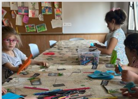
Los más jóvenes disfrutaron de las actividades de “Sancri Joven”.