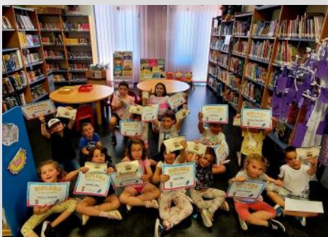
Despedimos la primera edición de “La hora del cuento”.