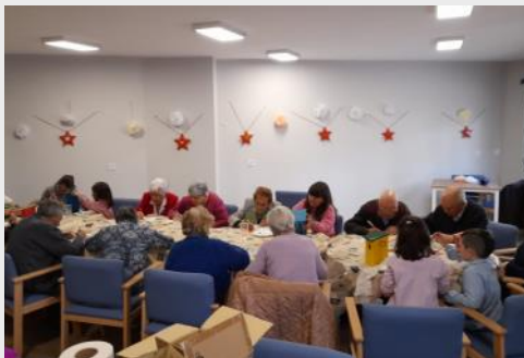
Nuestros mayores se divierten realizando talleres.