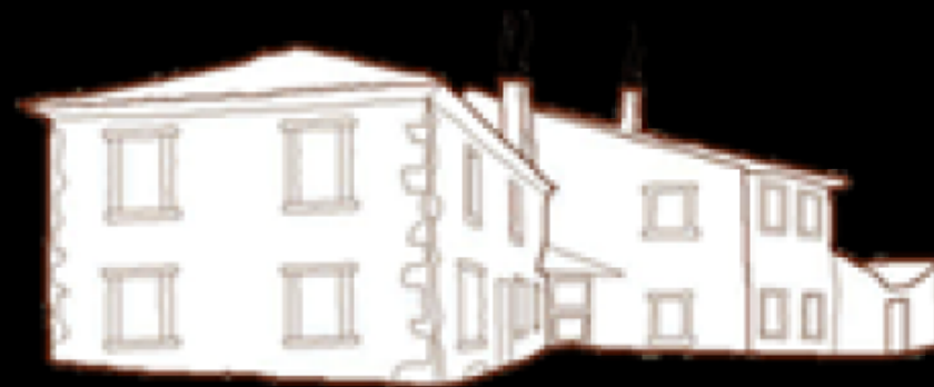
Molino de la Ferrería