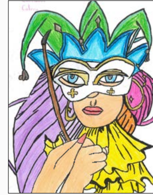
6º curso A Álvaro Ovejero Valero