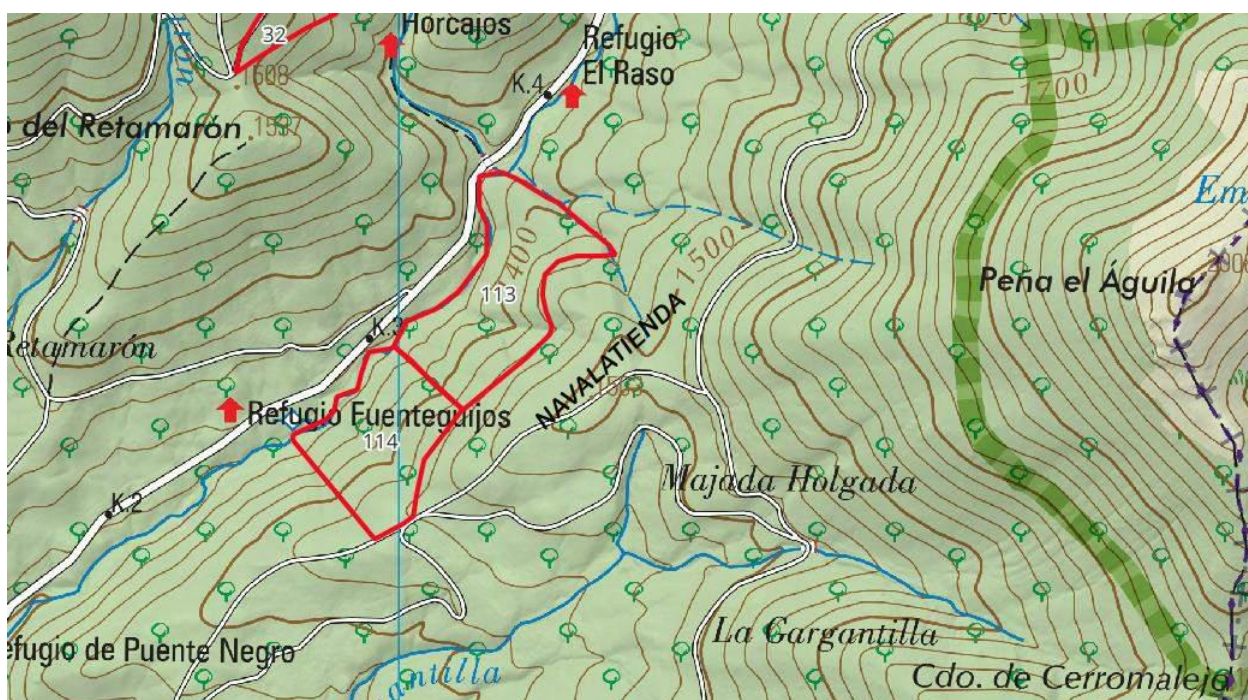
113 y 114 entre el Rio Moros y la "Loma de la Cacera"