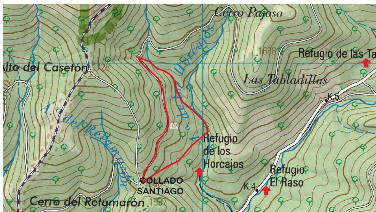
El 32, en la pista de la solana, desde el “Collado Santiago”

Los rodales son, el 32, 76, 113 114 y 132: