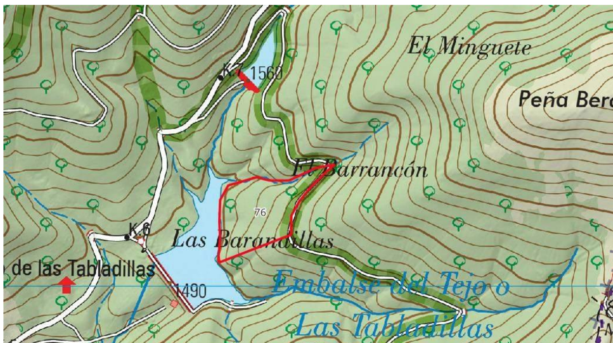
El 76, en el "Barrancón"