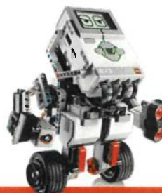
ROBOTIX 2 primaria