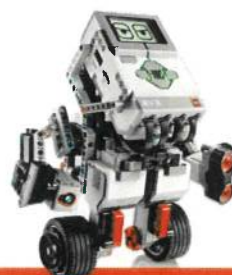
ROBOTIX 2 primaria