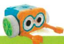
ROBOTIX 0 infantil