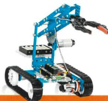
ROBOTIX maker ESO

ROBOTIX un proyecto completo para todas las etapas