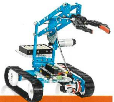
ROBOTIX maker ESO

ROBOTIX un proyecto completo para todas las etapas