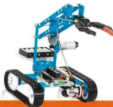
ROBOTIX maker ESO

ROBOTIX un proyecto completo para todas las etapas