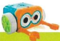
ROBOTIX 0 infantil