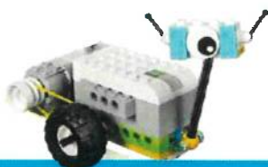
ROBOTIX 1 primaria