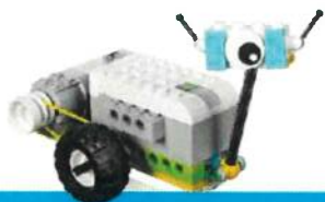
ROBOTIX 1 primaria