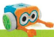
ROBOTIX 0 infantil