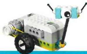
ROBOTIX 1 primaria