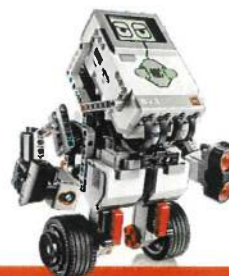
ROBOTIX 2 primaria