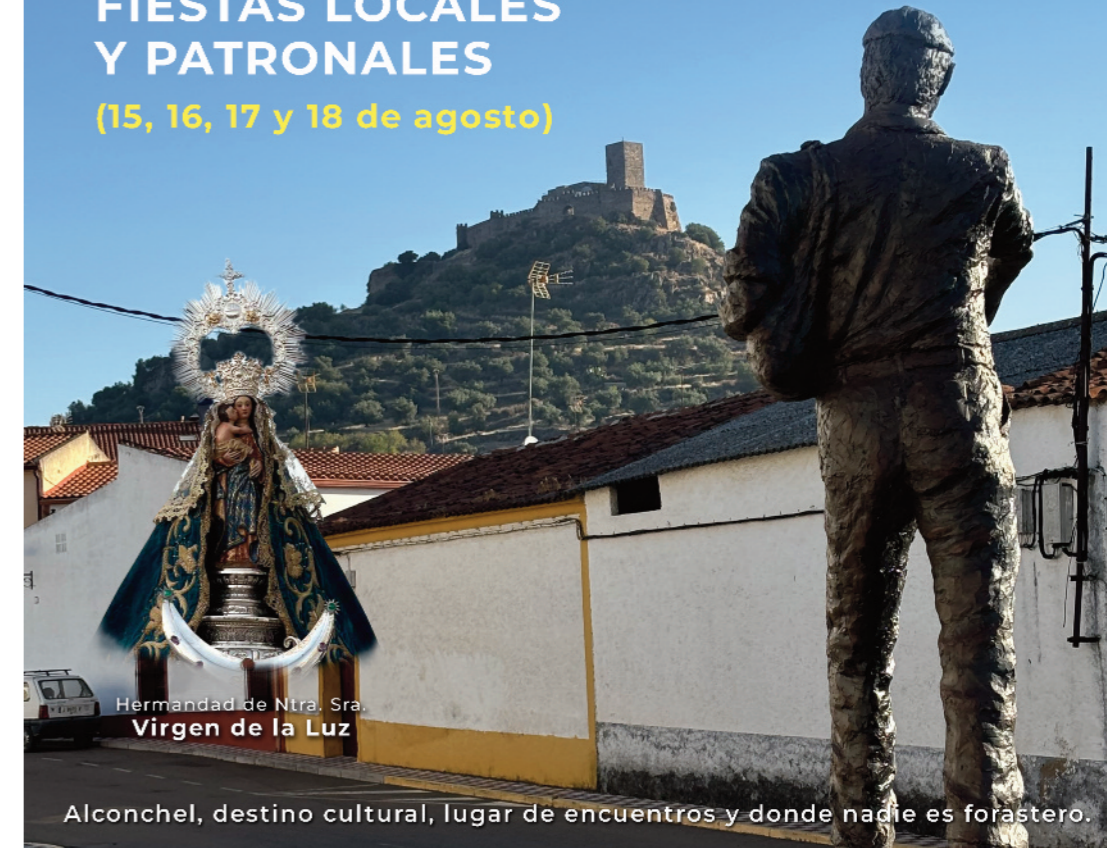
Hermandad de Ntra. Sra. Virgen de la Luz

FIESTAS LOCALES Y PATRONALES (15, 16, 17 y 18 de agosto)