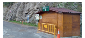
Aparcamiento de San Úrbez Cañón de Añisclo