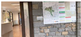
C/ Iglesia, s/n. 22375. Fanlo. Tel. 974 94 81 50