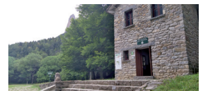
Pradera de Ordesa