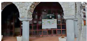
Plaza Mayor, 7. 22350. Bielsa. Tel. 974 50 10 43

Abierto todos los días en horario ininterrumpido de 8:00 a 17:00 h.