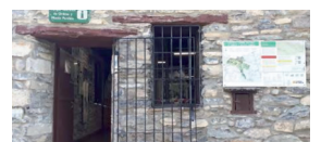
C/ Única, s/n. 22362. Escuaín. Tel. 974 94 15 60