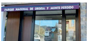
Avda. Pineta. Ed. Portal de Añisclo, 9. 22363. Escalona. Tel. 974 50 51 31

Abierto de miércoles a domingo de 9:00 a 14:00 y de 16:15 a 19:00 h.