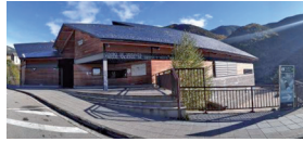
Avda. Ordesa s/n. 22376. Torla-Ordesa. Tel. 974 48 64 72

Abierto todos los días en horario ininterrumpido de 8:00 a 17:00 h.